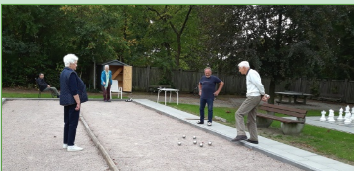
Schach und Boule im Dorfpark am Schulweg